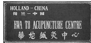
HTC-plaquette in originele staat' en HTC-plaquette, bijgeknipt