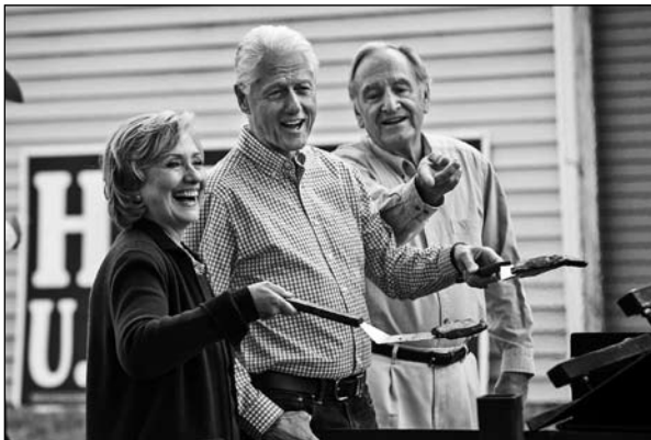
Echtpaar Clinton met Harkin op zijn afscheidsfeest sept. 2014