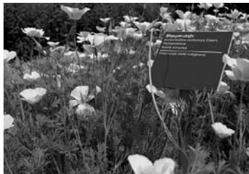
Slaapmutsjes in VSM-tuin

de tuin nog open voor publiek. Geïnteresseerde ramptoeristen kunnen er het volgende verwachten: 'Tijdens een twee uur durend bezoek krijgt u het gehele proces 'van plant tot klant' te zien. Het zal u zeker verrassen. Uw bezoek aan VSM begint in de tuinzal met een kopje koffie of thee met iets lekkers er bij. In een korte film wordt aan u het productieproces van de homeopathische geneesmiddelen uitgelegd. Daarna gaat u met een ervaren gids de tuin in voor een rondwandeling van ruim een uur. In de ecologische tuin van ruim drie hectare staan meer dan vijf honderd verschillende soorten planten, waarvan tijdens de zomermaanden altijd een groot deel in bloei staat. VSM kweekt alle plantaardige grondstoffen zelf om er zeker van te zijn dat de basis van haar geneesmiddelen van goede kwaliteit is. Natuurlijk worden daarbij geen bestrijdingsmiddelen of kunstmest gebruikt. De gids geeft ook uitleg over de betekenis van de planten voor de homeopathie. U zult verbaasd zijn over zoveel natuur op een Alkmaars bedrijventerrein.' Aldus de propagandamachine van VSM. Dit jaar voor het laatst en dan: opgeruimd staat netjes. ■