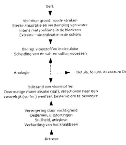
Figuur afkomstig uit de Weledabrochure

stimuleert – volgens haar eigen website – meer bewust gebruik van het geld en stimuleert innovatieve ontwikkelingen. Sinds 1980 heeft de Foundation zich beperkt tot het leveren van bijdragen aan projecten. Zoals uit het Kackadorisjurypapport blijkt, worden onder innovatieve ontwikkelingen ook de acupunctuur, de tropische homeopathie en natuurlijk de antroposofische geneeskunde gerekend. Fossiele geneeswijzen tot ‘innovatief’ verklaren: je moet maar durven. ‘Het werk van de Foundation wordt mogelijk gemaakt door de donaties van Triodos Bank en haar klanten, in de vorm van vele grote en kleine geschenken. Vestigingen van Triodos Bank in België, het Verenigd Koninkrijk en Spanje hebben elk een vergelijkbare stichting. Triodos Foundation heeft een bestuur van drie leden. Leden van het bestuur ontvangen geen vergoeding van de Stichting voor hun werk. De raad vergadert regelmatig, met tussenpozen van een tot twee maanden. Triodos Bank betaalt het personeel van de Stichting, alsmede de kosten van het kantoor. Daarnaast is Triodos Foundation toegestaan om alle faciliteiten van het kantoor van Triodos Bank te gebruiken. Op deze manier worden de kosten van Triodos Foundation laag worden gehouden. Donoren kunnen dus verzekerd zijn dat hun gift volledig wordt gebruikt voor het beoogde doel,’ aldus de Triodos – ‘Gebruik je hoofd, volg je hart’ – website.