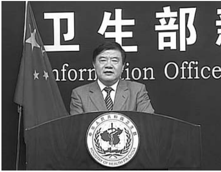
Minister Chen Zhu