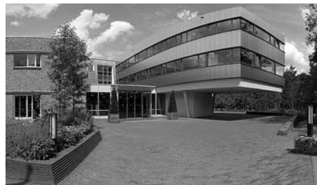
Triodos Bank, Zeist

De driegeleding moet niet verward worden met de vierledigheid die de mens zou kenmerken en die onder meer staat beschreven in de Weleda-brochure Antroposofisch georiënteerde geneeskunde en farmacie , die ik 'gedrukt op milieuvriendelijk papier' vanuit Zeist kreeg toegestuurd, nadat Triodos de Kackadorisprijs had gewonnen. De vier geledingen bestaan uit achtereenvolgens fysieke materie i.e. de levensprocessen, het levenslichaam (ook wel het 'etherisch lichaam') en het gewaarwordingslichaam (ook wel het 'astrale lichaam') en de ik-organisatie. Als u hier de tel bent kwijt ge-