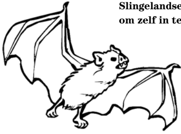
Slingelandse vleermuis om zelf in te kleuren