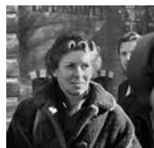
Gerda Verburg, mi- nister voor alterna- tieve geneeswijzen

Ad 1) Reeds in 2003 heeft de VtdK er bij de hoogste veterinaire ambtenaar ( Chief Veterinary Officer-CVO ) vergeefs op aangedrongen om actie te ondernemen tegen de onbevoegde uitoefening van de diergeneeskunde door op HBO-niveau opgeleide behandelaars. De Koninklijke Nederlandse Maatschappij voor Diergeneeskunde heeft bij het Ministerie van LNV ook bot gevangen ten aanzien van de onbevoegde uitoefening van de diergeneeskunde door niet-dierenartsen. Bij het Ministerie van Onderwijs Cultuur en Wetenschap is evenmin gehoor gevonden.