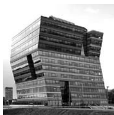
Hoofdkantoor Menzis, royale behuizing

en vast bedrag. De aanvullende verzekering van Menzis vergoedt alle therapeutische zorg van deze zorgverleners'. Aldus een persbericht van een der grootste ziektekostenverzekeraars van ons land.