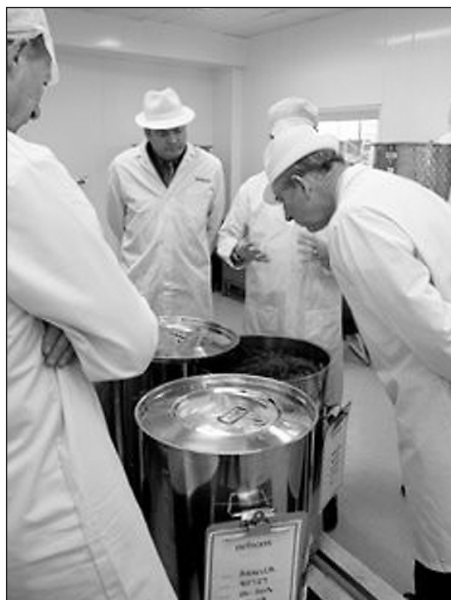
Z.K.H. prins Charles bezoekt een homeopathiefabriek

Lijkt het in ons land toch wel ondenkbaar dat de Natuurstichting van prinses Irene overheidssubsidie zou krijgen om een goede registratie van betrouwbare alternieuten in het leven te roepen, de Britten zitten er niet mee. Daar heeft de door Prins Charles, een man die door sommigen voor intellectueel wordt aangezien (maar niet door David Colquhoun), opgerichte Foundation for Integrated Health met subsidie van het Ministry of Health een raad opgericht die een register van erkende kwakzalvers gaat instellen. Ingeschrevenen zouden een keurmerk mogen voeren en dat zou hen geen windeieren leggen.