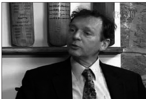
Sheldrake: reeds in de jaren '80 losgeraakt van de wetenschap