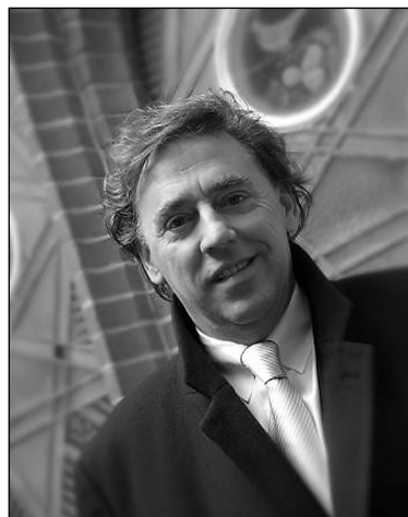
Nijpels, onvoldoende geïnformeerd

Het bestuur heeft GS inmiddels laten weten dat het zich met deze brief nog niet 'voldoende geïnformeerd' acht en verzocht een iets inhoudelijker reactie.