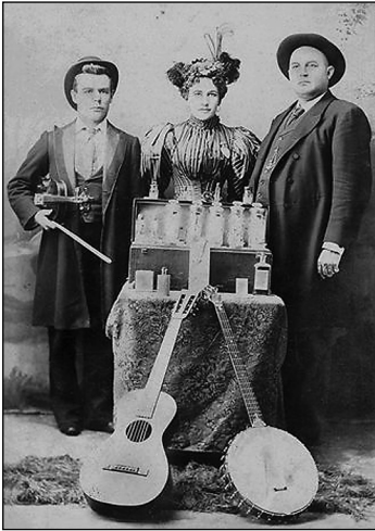
Medicine Show Trio, 1890

(Salisbury, 1886 - Spartanburg, 1958) getiteld Another soul made happy . Vertaald luidde dat als volgt: