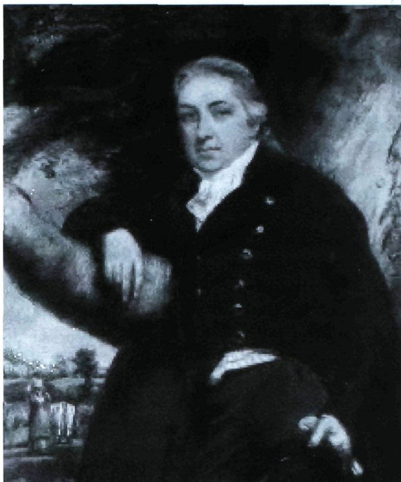
Edward Jenner, grondlegger van het vaccineren.